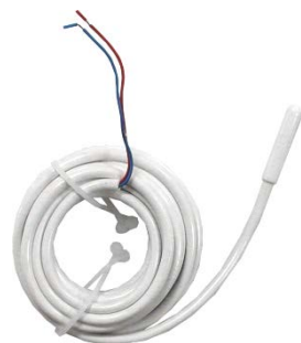
Tillbehör - Extern givare 10 kΩ vid 25°C